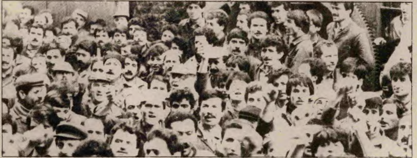
Deri-İş grevinin başarısının sırrı, işçilerin, proleter yöntemlerle militan yığınsal savaşımı yükseltmiş olmasıdır.

İşverenler görüşmeleri geciktirerek grevcileri yıldıracaklarını sanıyorlarsa aldanıyorlar